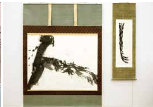
佳波佳都子 [書] / 春原敏雄 [表具]