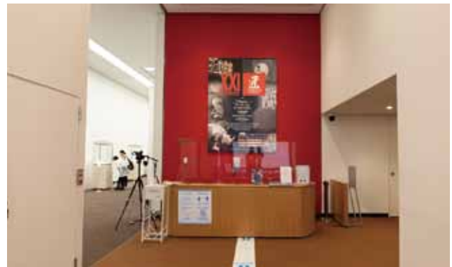
2021年（東京都美術館 4F 展示室）

※展示の場所等は、当委員会の学芸員にて構成いたします。また申し込み順にて優先して決定いたします。